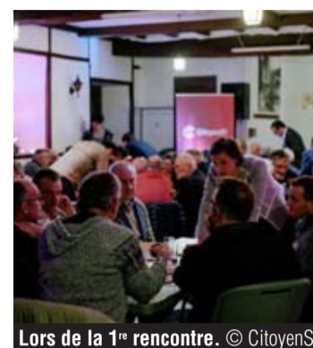
Lors de la 1 re rencontre. © CitoyenS

Mais CitoyenS a aussi planché sur son code de déontologie, alors que la procédure de candidature est lancée pour se présenter sur la future liste. « Il y a notamment, le point dans lequel le candidat s'engage à s'opposer à toute forme d'extrémisme niant les droits fondamentaux de la personne, à refuser toute alliance avec des mandataires de partis non-démocratiques et à s'interdire de voter pour eux lorsqu'ils présentent leur candidature à un mandat public. Bref, on s'interdit d'emblée toute alliance