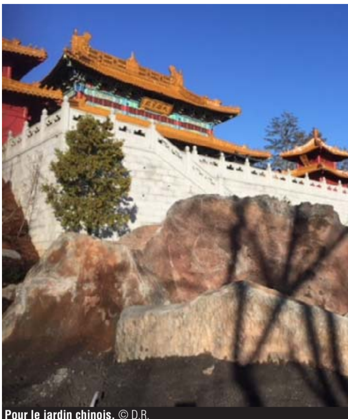
Pour le jardin chinois.

Le responsable botanique du parc s'est rendu sur place, à Mal-